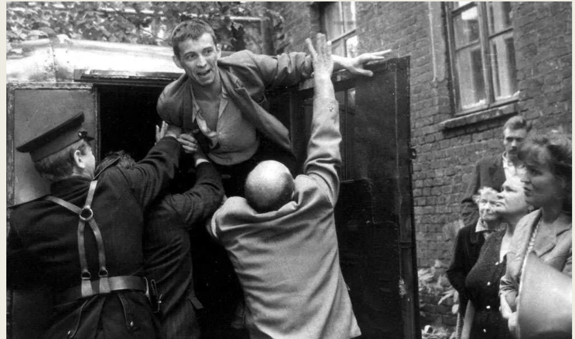
Кадр из фильма «Прощай, шпана замоскворецкая...», 1987 г., реж. Александр Панкратов