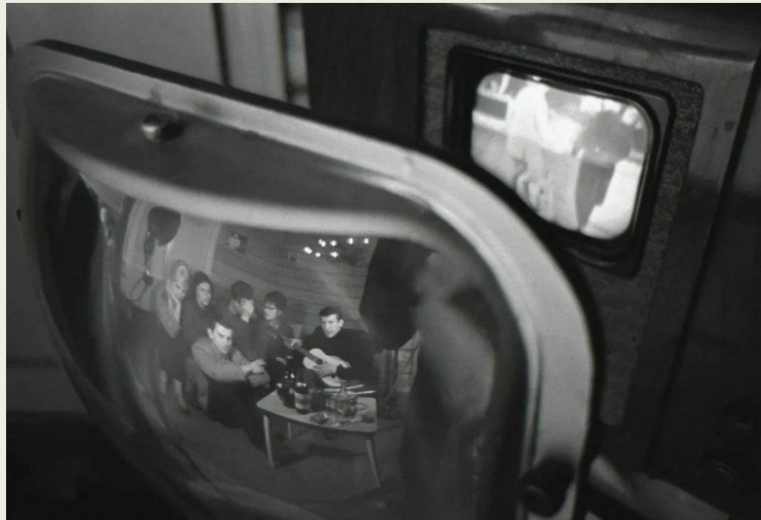
«Телевизор», 1962 год.