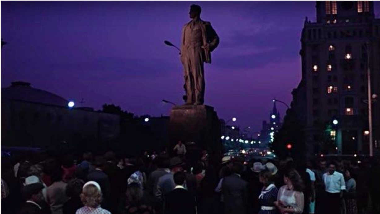
Кадр из фильма «Москва слезам не верит», 1979 г., реж. Владимир Мэнш шед