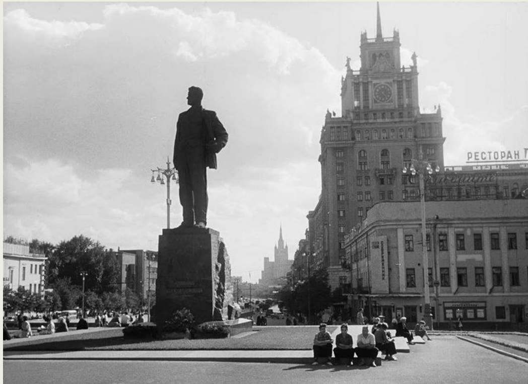
Кадр из документального фильма "Я иду по Москве", 1962.

Это звучало над площадью Маяковского, словно здесь и сейчас найденное слово».