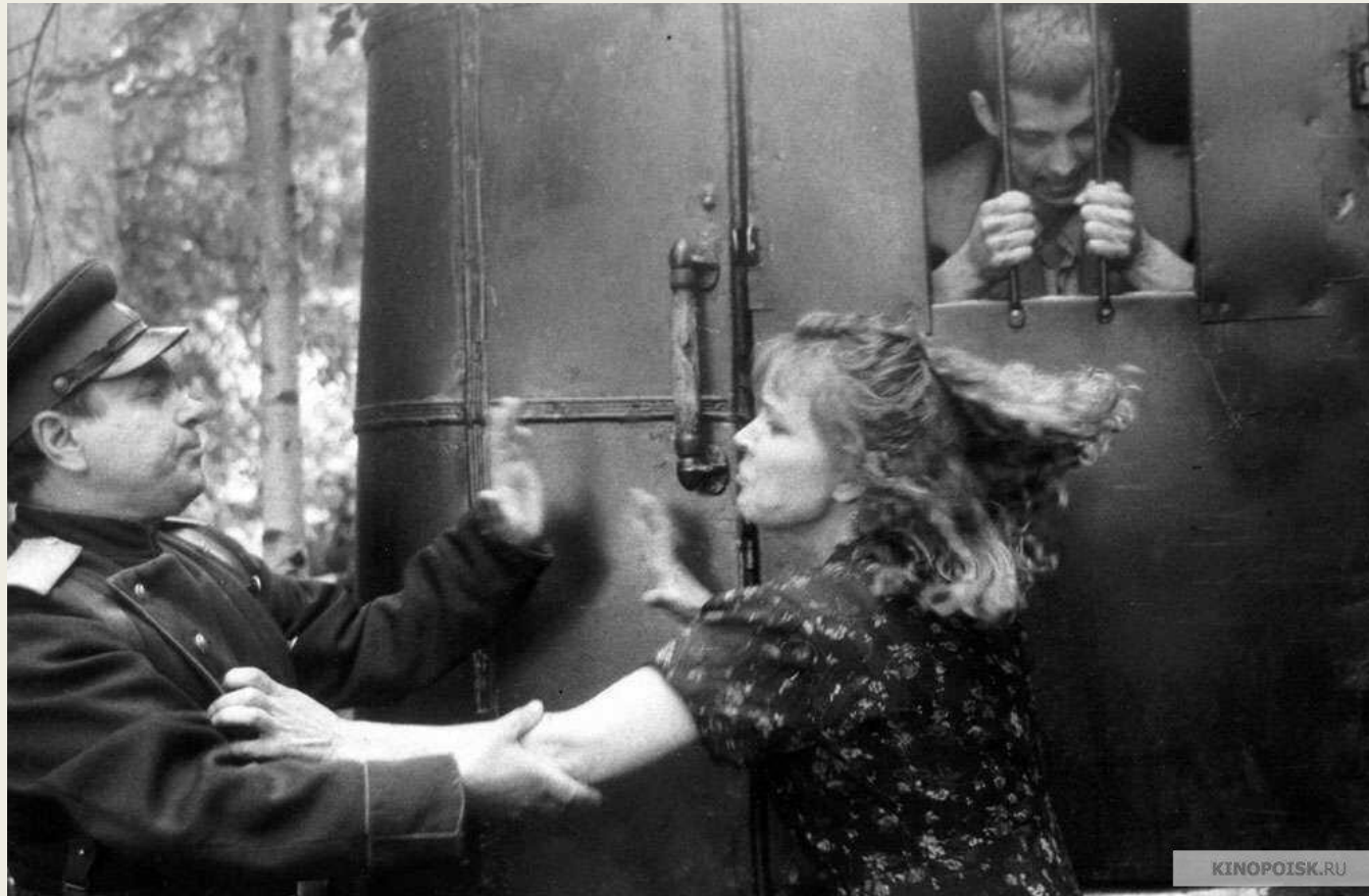
Кадр из фильма «Прощай, шпана замоскворецкая...», 1987 г., реж. Александр Панкратов