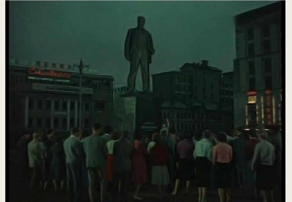
Кадр из фильма «Леон Гаррос ищет друга», 1960 г., реж. Марсель Палиеро