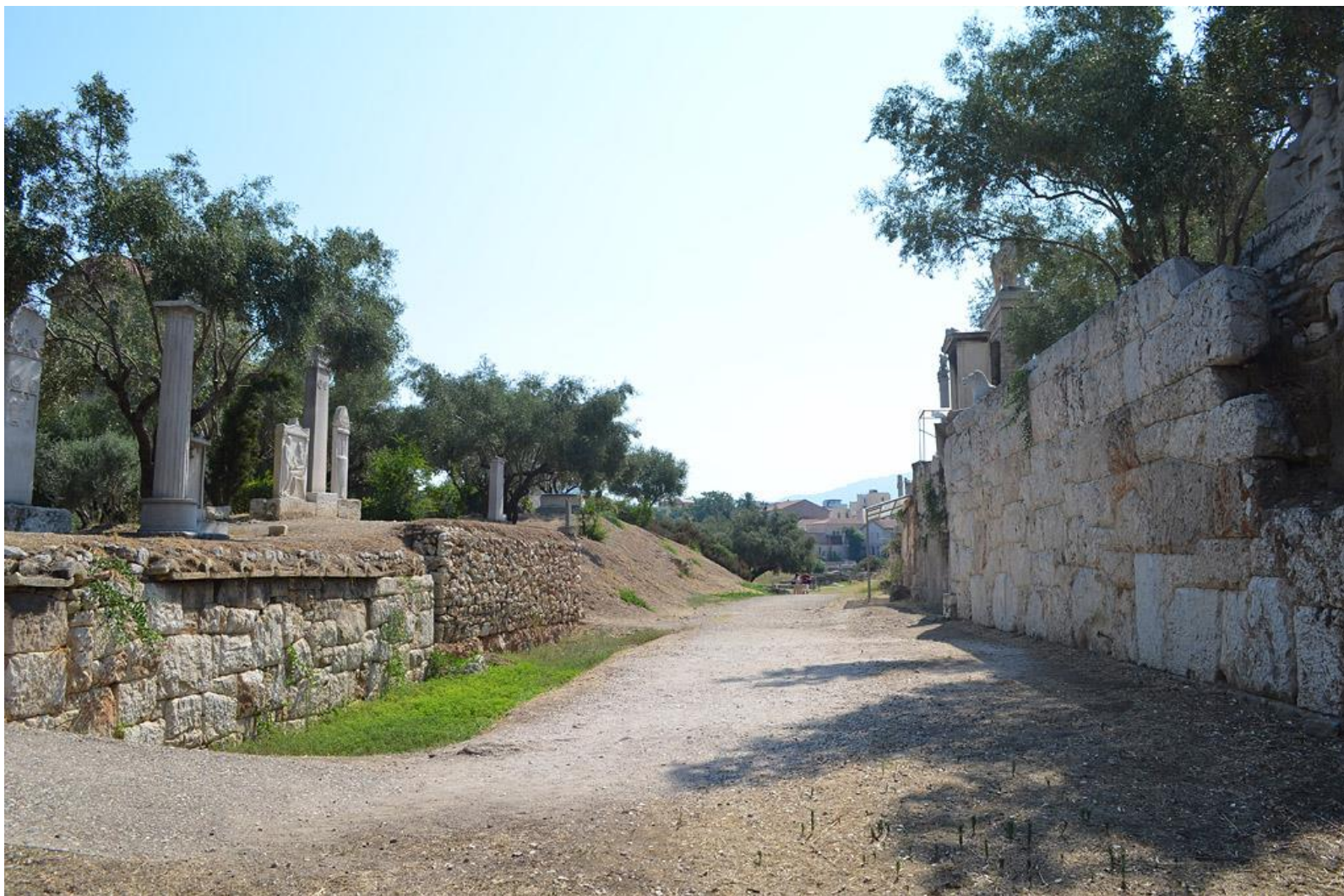
Дорога из Элевсина в Афины