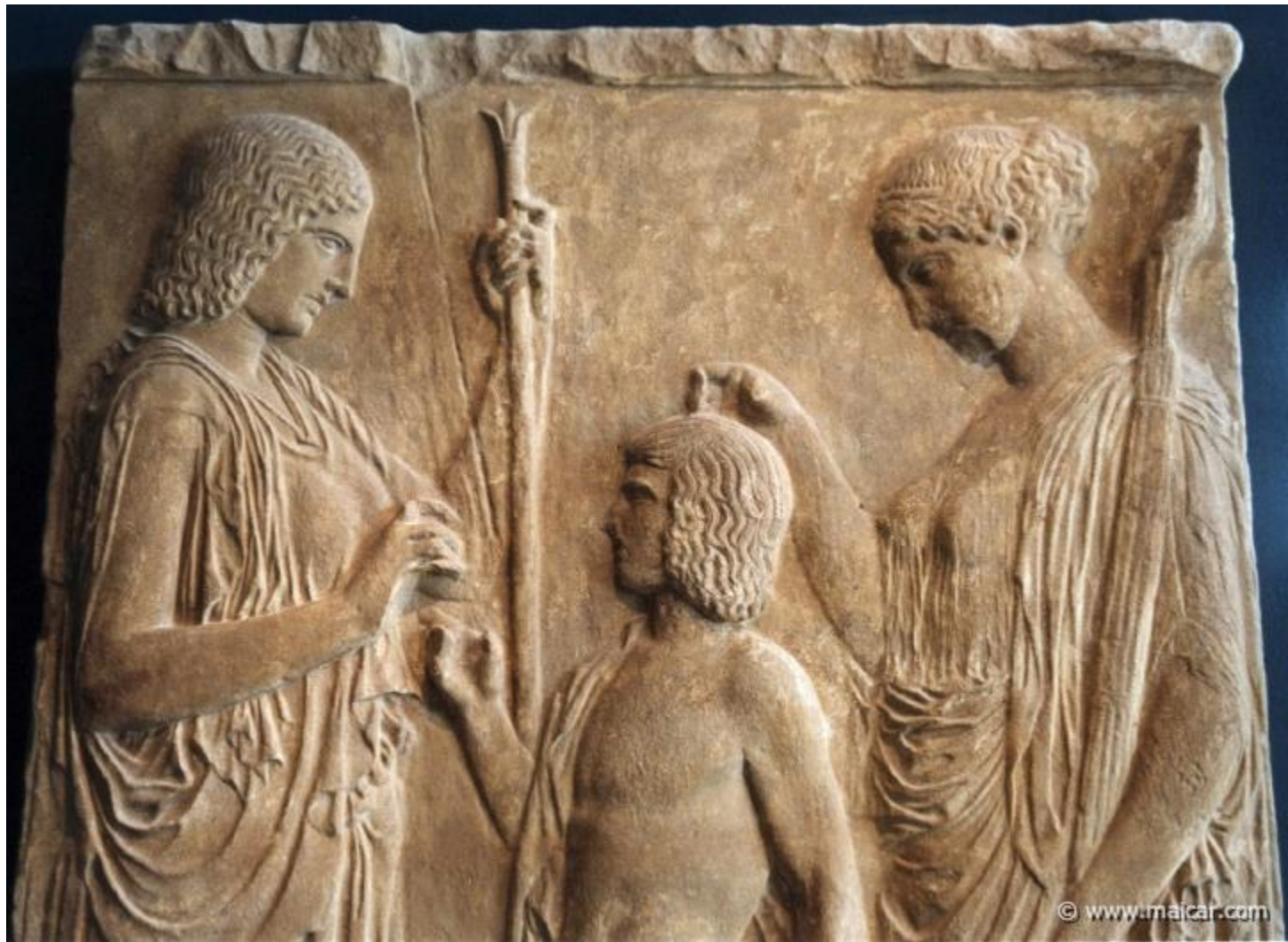
Деметра, Триптолем и Персефона (деталь). Копия Элевсинского рельефа ок. 440 г.до н.э. Археологический музей. Элевсин. Триптолем получает семена пшеницы от Деметры и благословение от Персефоны.