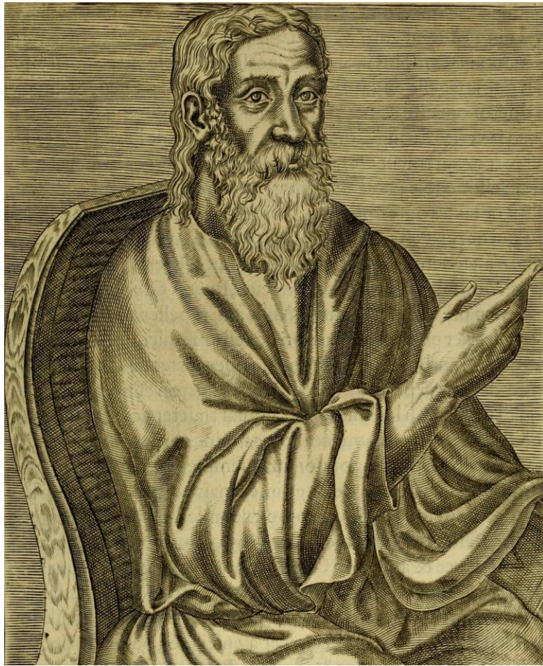
Климент Александрийский. ок. 150— ок. 215