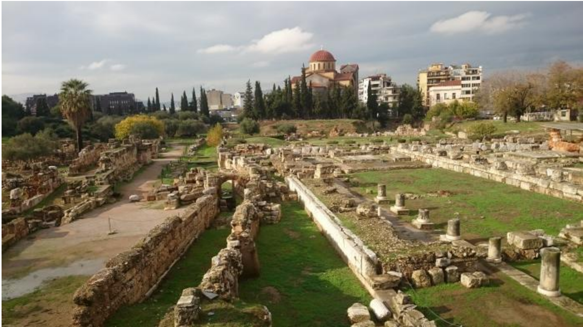
Священная дорога из Афин в Элевсин