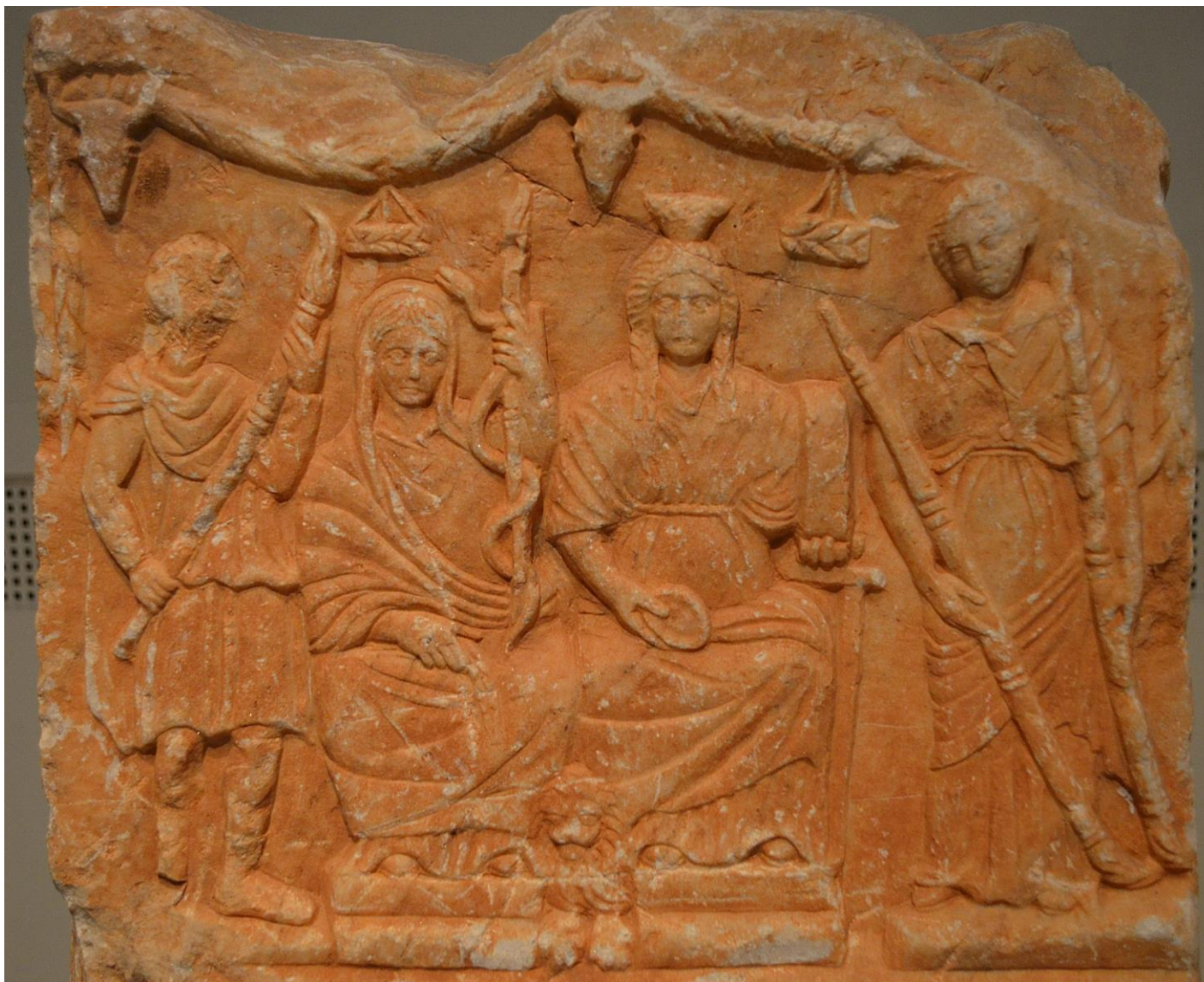
Алтарь IV в. н.э. Археологический музей. Афины. Череп тельцов и корзины, подвешенные к плетеной гирлянде