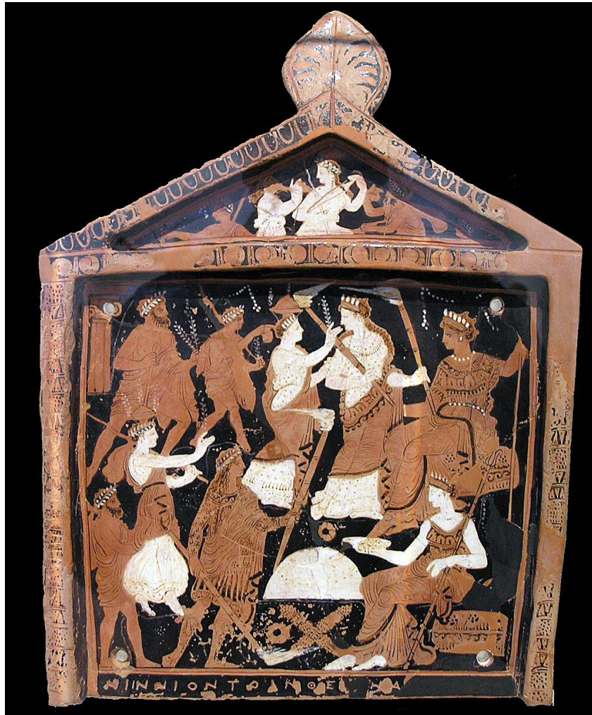
Элевсинские мистерии (шествие с факелами). Гидрия. Варезский вазописец, ок. 430 до н. э., Берлинское античное собрание