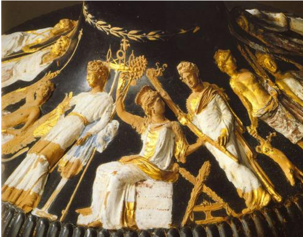
Элевсинские таинства, или мистерии