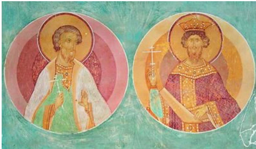
Мученики кн. Михаил Черниговский и боярин Феодор. Роспись собора Рождества Пресв. Богородицы Ферапонтова мон-ря. 1502 г.