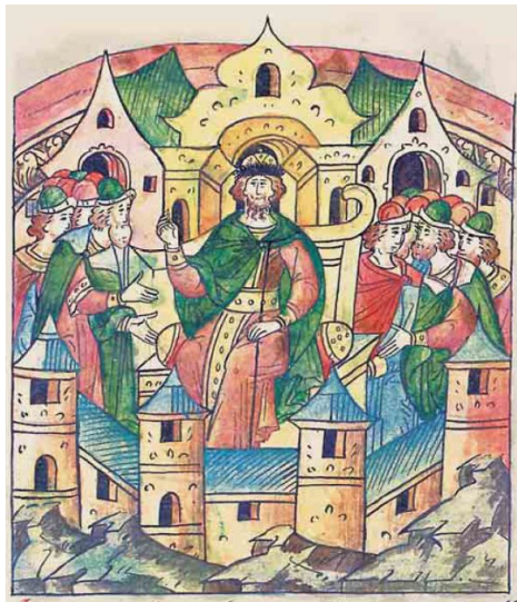
Лицевой летописный свод. 70-е гг. XVI в. (РНБ. F.IV.233.)